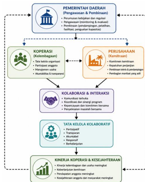
Gambar 2. Model Konseptual Penelitian

Sebagai landasan analisis, penelitian ini mengacu pada pendekatan collaborative governance yang menekankan pada pentingnya interaksi dan kolaborasi antara berbagai aktor dalam mencapai tujuan bersama. Dalam konteks ini, tata kelola pengawasan dan pembinaan koperasi dipandang sebagai hasil dari interaksi antara pemerintah daerah, koperasi, dan perusahaan dalam suatu sistem kemitraan.