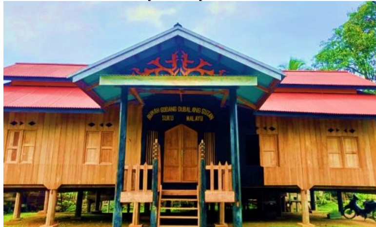
Gambar 4 Rumah Adat Suku Melayu/Malayu