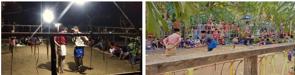
Gambar 8 Proses Latihan Silat pada malam hari di bulan Ramadhan (sebelah kiri) dan pertunjukan (sebelah kanan)

Pertunjukan silat yang diselenggarakan pada hari raya ke-dua di idul fitri ini diikuti oleh laki-laki usia anak-anak, remaja hingga dewasa . Biasanya dilakukan setelah ziarah kubur, dan melakukan silaturahmi di Rumah Adat Atau Rumah Godang. Pertunjukan ini dipimpin oleh guru silat itu sendiri. Proses latihan dilakukan selama bulan Ramadhan pada malam hari, dilakukan setelah selesai menunaikan ibadah sholat Tarawih hingga malam atau pagi hari tergantung banyaknya peserta yang latihan.[9]