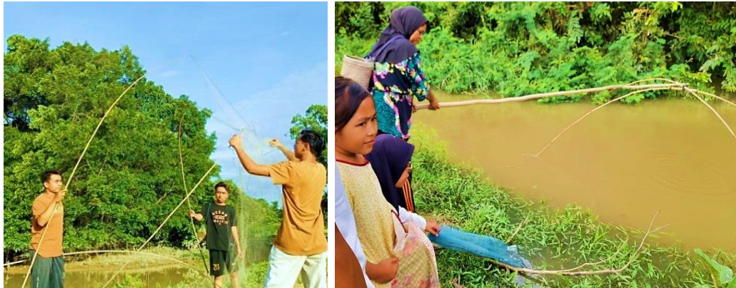
Gambar 7 Menggunakan alat Manyintak/Menyintak

Kegiatan mencari ikan dengan jaring khusus ini biasanya dilakukan oleh kaum Ibu-Ibu sejak pagi pukul enam atau sore hari sekitar pukul lima sore. Desa ini adalah salah satu desa yang di lalui oleh sungai kuantan, sehingga terdapat aliran-aliran kecil sungai yang tidak jauh dari perumahan warga, dan disinilah kegiatan menyintak/manyintak itu dilakukan.