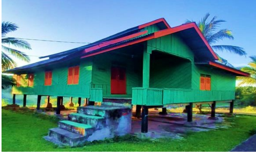
Gambar 1 Rumah Adat Suku Paliang