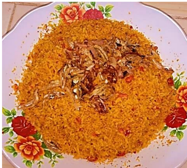
Gambar 6 Sambal Karambial Khas Koto Sentajo

Hasil dari pengolahan tersebut dapat dilihat pada gambar berikut ini: