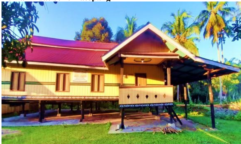
Gambar 3 Rumah Adat Suku Patopang