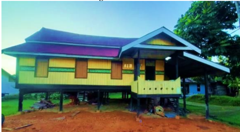
Gambar 2 Rumah Adat Suku Caniago