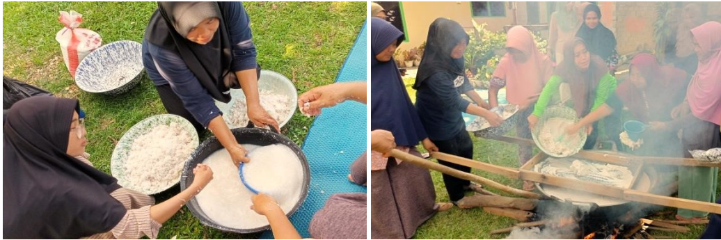
Gambar 9 Proses memasak Konji Anak Loba bersama warga Desa Koto Sentajo