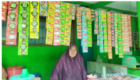
Gambar 1. Survei awal usaha