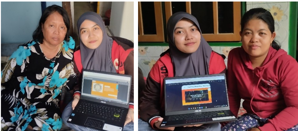
Gambar 2. Sesi pemaparan materi terkait pentingnya pengembangan pemasaran

Setelah survei, program dilanjutkan dengan sesi pengajaran materi yang berlangsung maksimal selama satu jam. Materi yang disampaikan menyesuaikan dengan kebutuhan UMKM.