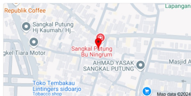
Gambar 3. Sesi praktik digital marketing dan tampilan pada google maps

Pengeditan Anda untuk Anyaman Bambu Bu Rukiyah diterima. Terima kasih telah membuat Google Maps lebih akurat dan andal.