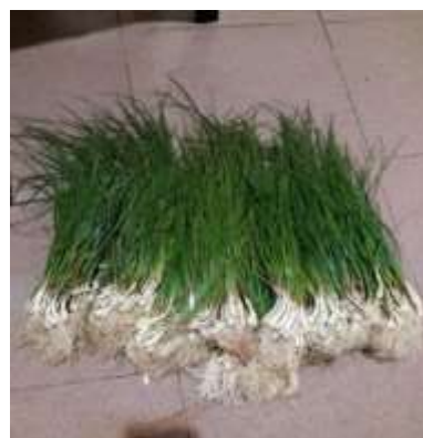
Gambar 1. Tanaman bawang batak

1 adalah gambar tanaman bawang Batak dapat dilihat dibawah ini.