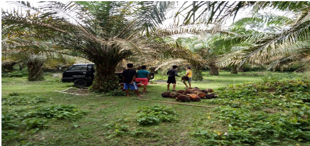
Gambar 4. Lahan kebun sawit warga di desa Padang Kunyit