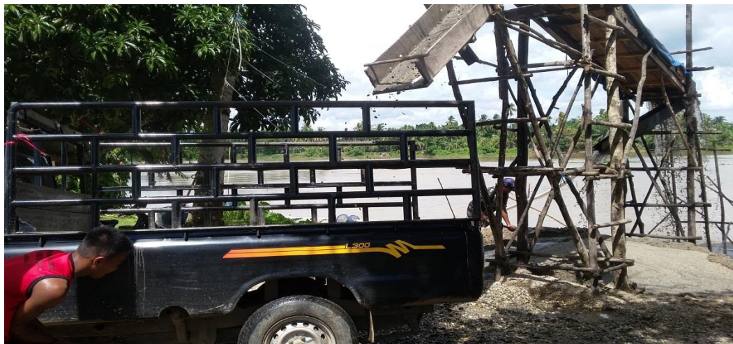
Gambar 2. Tambang batu/pasir di desa Teluk Pauh

Penulis juga mengadakan wawancara dengan dua orang warga yaitu Bapak Iskandar dan Pak Fitra warga desa Pangean bagian Selatan dimana satu orang merupakan petani kebun karet dan satu orang berkebun sawit yang masing-masing beralamat di desa Pematang dan Padang Kunyit Pangean, penulis menanyakan : “Bagaimana proses bapak membeli pupuk untuk lahan perkebunan sebelum dan sesudah adanya jembatan ?