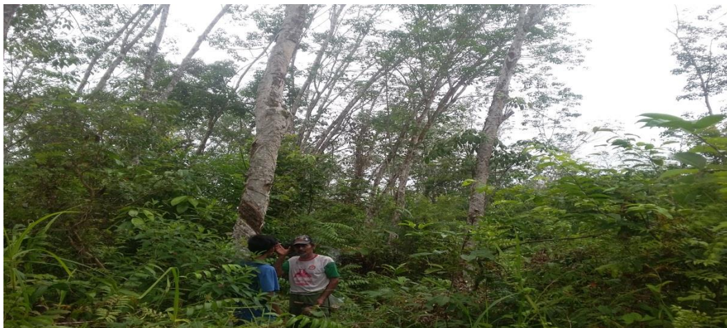
Gambar 3. Wawancara dengan seorang petani kebun karet di desa Pematang.

Jawaban : “Pak Iskandar menyatakan bahwa dengan adanya pembangunan Jembatan Pangean kami lebih mudah membeli pupuk untuk kebun karet kami ke Pasar baru Pangean, ke Baserah atau ke Benai tanpa harus menempuh jarak yang cukup jauh atau memerlukan biaya besar untuk membongkarnya di penyeberangan, selama ini kami hanya bisa membeli sedikit saja pupuk karena transportasi yang terbatas dan sangat jauh jika melewati jembatan Benai atau jembatan Baserah.”