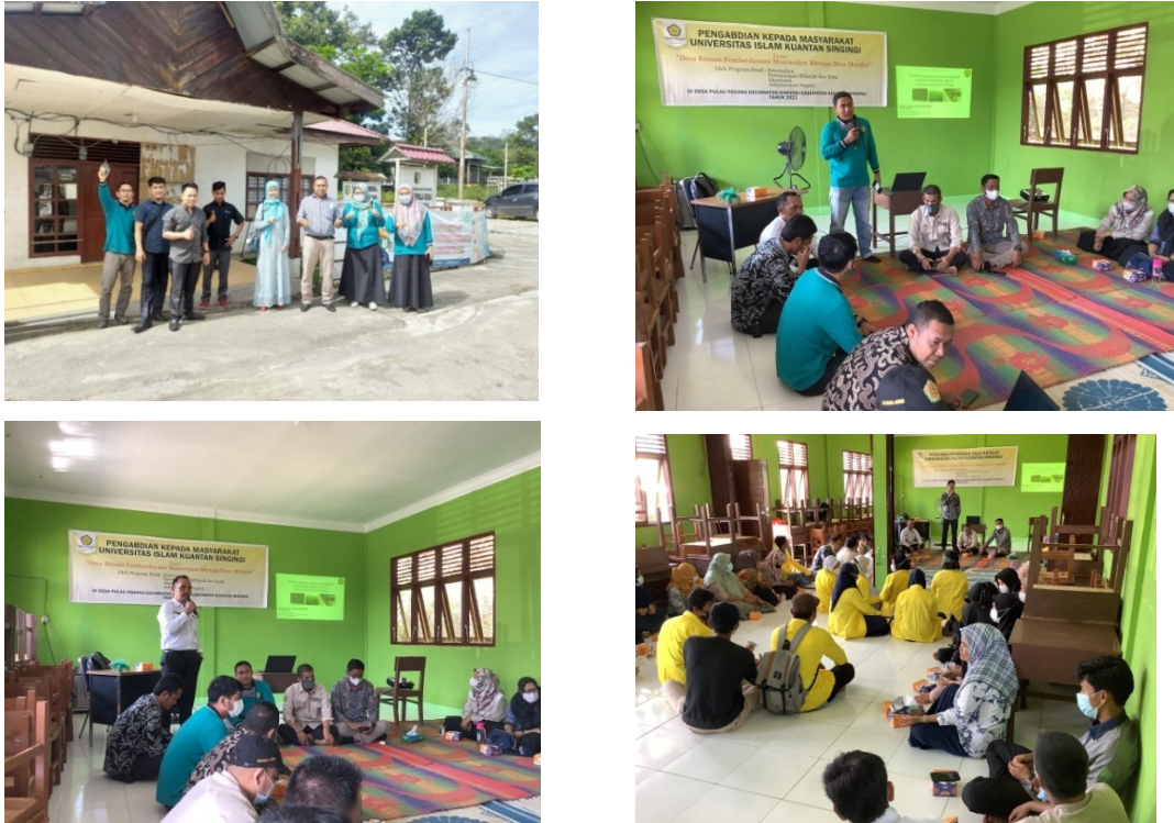
Gambar 1. Proses Pelaksanaan PKM.

ada di Desa ini yaitu wisata alam berupa adanya aliran sungai alami yang dapat dimanfaatkan untuk kegiatan wisata. Akan tetapi dengan potensi wisata yang besar tidak diiringi dengan perencanaan pariwisata yang baik. Oleh karena itu perlu dilaksanakan pengabdian masyarakat dalam hal pendampingan dalam konsep pariwisata di Desa Pulau Padang tersebut.