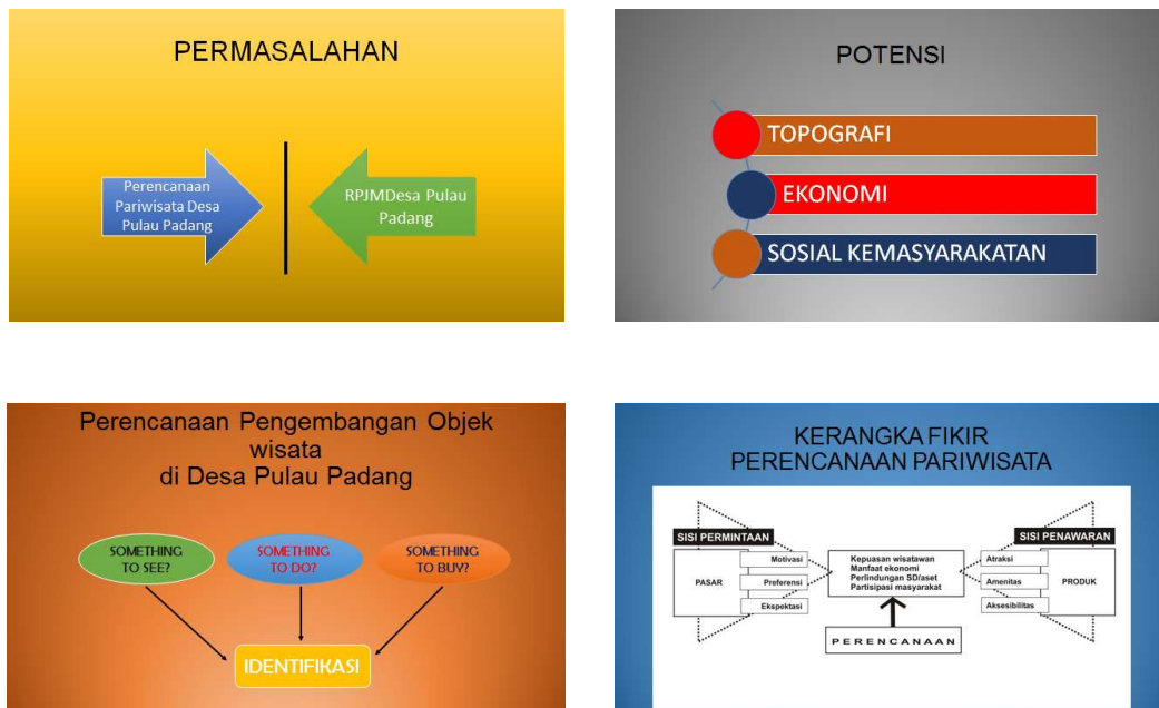
Gambar 2. Masalah dan potensi di Desa Pulau Padang.

Pengabdian kepada Masyarakat dilakukan dengan cara menyampaikan materi dari Program Studi Perencanaan Wilayah dan Kota UNIKS dan di lanjutkan dengan diskusi dengan Perangkat dan masyarakat Desa tentang Potensi Wisata yang akan di kembangkan. Dalam melaksanakan Pengabdian Masyarakat, Program Studi Perencanaan Wilayah dan kota dengan tema : Perencanaan kawasan Pariwisata di Desa Pulau Padang, Kec. Singingi, Kab. Kuantan Singingi mendapatkan hasil data yang akan di jadikan sebagai analisa kawasan Pariwisata di desa Pulau Padang, dari data lapangan dan hasil RPJMDES tahun 2018- 2024 Ada Beberapa hambatan/masalah dan potensi yang bisa di kembang di Desa Pulau Padang. Berikut ini cara mencari masalah dan potensi yang ada di Desa Pulau Padang.