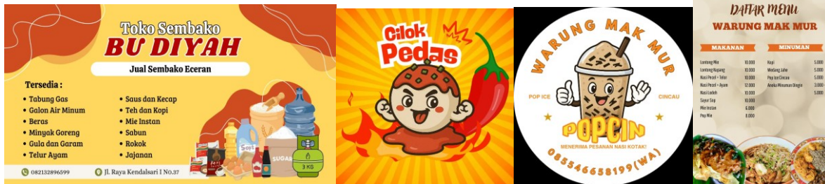
Gambar 3. Pelatihan Pembuatan Elemen Visual Pendukung Meliputi Banner, Logo, Stiker Produk, dan Daftar Menu,

branding dari UMKM. Kegiatan ini juga diharapkan para pelaku UMKM memiliki keterampilan baru dalam hal promosi digital dan mampu menghasilkan video promosi kreatif.