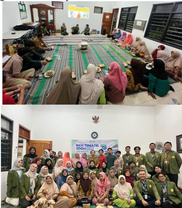
Gambar 1. Penyuluhan “Belajar Bareng UMKM : Bikin Usaha Lebih Menarik & Jualan Makin Gampang Lewat Digital”

Sosialisasi ini dilakukan guna memberi pemahaman kepada pelaku UMKM RW 03 tentang bagaimana pemanfaatan teknologi sebagai alat untuk memperluas jangkauan pemasaran. Materi penyuluhan yang diberikan kepada pelaku UMKM juga menekankan pentingnya branding pada produk yang dijual sehingga mampu membangun identitas produk serta dapat menarik minat konsumen (Octaviani et al. , 2024). Dengan adanya penyuluhan ini, diharapkan pelaku UMKM mulai menyadari pentingnya membangun identitas produk sehingga produk mereka memiliki nilai tambah dan mampu bersaing di era digital ini (Sudaraso et al. , 2023). Branding produk yang kuat akan mendukung strategi digital marketing yang dilakukan oleh pelaku UMKM.