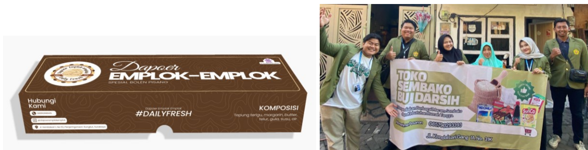
Gambar 4. Kegiatan Pendampingan UMKM Penjaringan Sari

Tahap terakhir dari pemberdayaan UMKM melalui branding dan digital marketing adalah pendampingan pelaku UMKM. Pendampingan dilakukan untuk memastikan penggunaan dan pemasangan media promosi diterapkan secara optimal. Mahasiswa aktif membantu pelaku mengatasi kendala teknis, mulai dari pengelolaan media sosial, dan pemasangan media branding maupun pemasaran. Pendampingan ini juga mencakup evaluasi berkala untuk memantau kemajuan, sekaligus memberikan solusi adaptif demi pemanfaatan teknologi digital yang lebih efektif dan berkelanjutan.