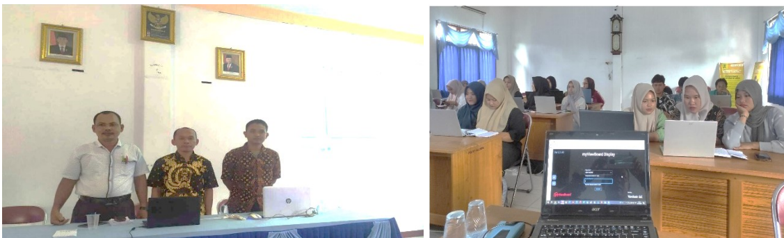
Gambar 1 dan grafik 1 dibawah ini foto tim pengabdian dan foto mitra pelatihan

Setelah penyampaian materi, kegiatan dilanjutkan dengan sesi diskusi dan tanya jawab. Pada sesi ini mitra diberikan kesempatan untuk mengajukan berbagai pertanyaan terkait proposal penelitian yang sedang mereka susun. Antusiasme peserta terlihat dari banyaknya pertanyaan yang diajukan, terutama mengenai teknik pengambilan sampel, penyusunan instrumen penelitian, dan pemilihan teknik analisis data yang sesuai dengan tujuan penelitian. Pertanyaan yang diajukan oleh mitra secara langsung oleh pengabdian diberikan penjelasan kembali dengan berbagai contoh ilustrasi yang mudah dipahami serta menunjukkan referensi yang mudah diakses, dengan jawaban secara langsung maka mitra dapat mengkonfirmasi kembali jika yang dipahami mmasih meragukan.