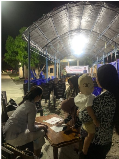
Gambar 2. Kegiatan Pelaksanaan Kunjungan Kerja Daerah Pemilihan (Kundapil)

Dalam pelaksanaan kegiatan pengabdian melalui program magang MBKM, mahasiswa turut dilibatkan sebagai bentuk dukungan terhadap kebutuhan sumber daya tambahan pada pelaksanaan kegiatan reses dan kundapil di DPRD Kota Palu. Selama pelaksanaan magang berlangsung, mahasiswa hadir dan terlibat secara langsung dalam mendukung pelaksanaan kegiatan reses dan kunjungan daerah pemilihan (kundapil) anggota DPRD Kota Palu. Keterlibatan tersebut dilakukan pada setiap tahapan kegiatan, mulai dari tahap persiapan, pelaksanaan, hingga pasca kegiatan sebagai bentuk dukungan terhadap pelaksanaan fungsi Sekretariat DPRD dalam memfasilitasi kegiatan penjangkaran aspirasi masyarakat.