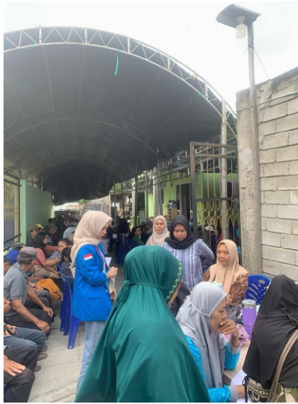
Gambar 1. Kegiatan Pelaksanaan Reses