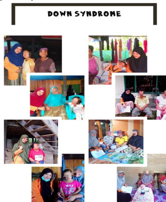
Gambar 1. Gambaran observasi berdasarkan penelitian pada tahun 2019

Kegiatan pengabdian kepada masyarakat ini dilaksanakan di Kecamatan Lembang, Kabupaten Pinrang, Sulawesi Selatan, dengan sasaran sebanyak delapan keluarga yang memiliki anak Down Syndrome . Program pengabdian ini merupakan tindak lanjut dari hasil penelitian yang dilakukan oleh tim pada tahun 2019 terkait perkembangan kemandirian dan keterampilan perawatan diri ( self-care skills ) anak Down Syndrome . Hasil penelitian menunjukkan bahwa sebagian besar anak masih mengalami ketergantungan dalam aktivitas kehidupan sehari-hari, seperti mandi, berpakaian, makan, dan menjaga kebersihan diri. Selain itu, ditemukan bahwa orang tua masih membutuhkan penguatan pengetahuan dan keterampilan dalam mendampingi anak untuk mencapai tingkat kemandirian yang lebih baik. Temuan ini sejalan dengan penelitian yang menyebutkan bahwa keterlibatan keluarga merupakan faktor penting dalam pengembangan kemampuan adaptif dan kemandirian anak berkebutuhan khusus [4], [2].