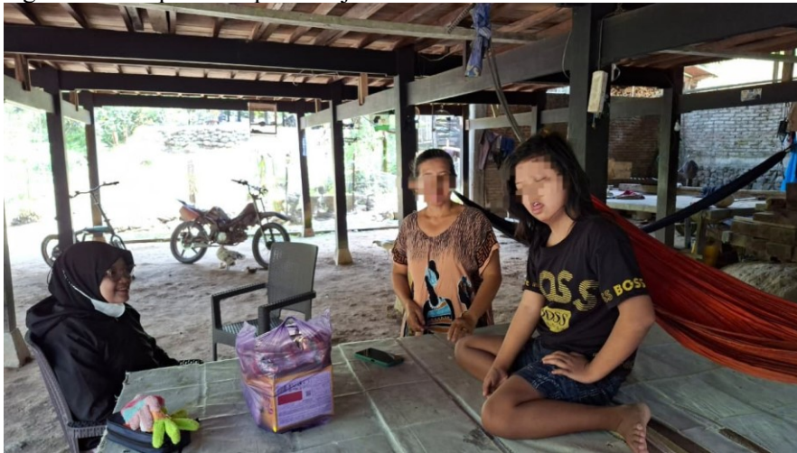
Gambar 2. Dokumentasi sesi berbagi cerita dengan orang tua anak pengidap down syndrome yang berusia remaja

Hasil observasi awal menunjukkan bahwa sebagian besar anak masih mengalami ketergantungan dalam beberapa aktivitas perawatan diri, seperti mandi, memakai pakaian, merapikan barang pribadi, dan menjaga kebersihan diri. Orang tua umumnya telah memberikan bantuan secara terus-menerus karena menganggap anak belum mampu melakukan aktivitas tersebut secara mandiri. Kondisi ini menyebabkan kesempatan anak untuk belajar dan mengembangkan kemampuan adaptif menjadi terbatas.