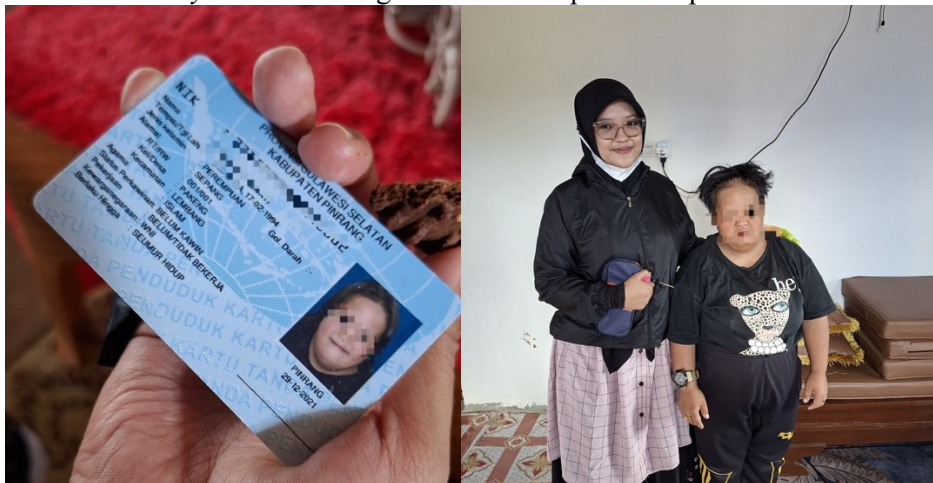
Gambar 5. Identitas pengidap down syndrome yang berusia 30-an

Peningkatan tersebut tidak terlepas dari penerapan strategi pembiasaan yang dilakukan secara berulang oleh orang tua di rumah. Pendekatan ini sesuai dengan karakteristik pembelajaran individu Down Syndrome yang memerlukan latihan berulang, instruksi sederhana, dan dukungan lingkungan yang konsisten[4], [5], [6]. Pendekatan task analysis yang digunakan dalam pendampingan membantu orang tua memecah aktivitas yang kompleks menjadi langkah-langkah sederhana sehingga lebih mudah dipahami dan dilakukan oleh anak. Temuan ini mendukung pendapat [5] yang menyatakan bahwa latihan yang terstruktur dan konsisten dapat membantu anak Down Syndrome meningkatkan keterampilan hidup sehari-hari secara bertahap.