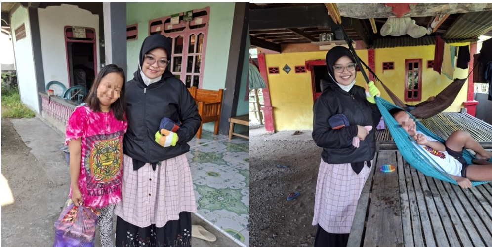
Gambar 6. Dokumentasi peningkatan kemandirian pada pengidap down syndrome usia remaja

Hasil pengabdian menunjukkan bahwa pendekatan berbasis keluarga tidak hanya meningkatkan kemampuan self-care skills , tetapi juga memperkuat peluang penyandang Down Syndrome untuk mencapai kualitas hidup yang lebih baik dan berpartisipasi secara aktif dalam lingkungan sosial. Kondisi ini sejalan dengan rekomendasi WHO yang menekankan pentingnya dukungan keluarga dan komunitas dalam meningkatkan kemandirian serta kesejahteraan penyandang disabilitas [1], [3], [10].