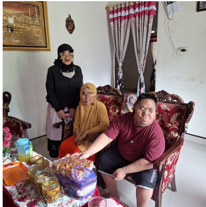
Gambar 3. Kondisi anak down syndrome yang kesulitan beradaptasi dan berkegiatan secara mandiri

Selain keterampilan-keterampilan tersebut, beberapa peserta juga masih memerlukan bantuan dalam melakukan aktivitas dasar lainnya, seperti makan secara mandiri, mencuci tangan dengan benar, serta merapikan barang-barang pribadi setelah digunakan. Temuan ini menunjukkan bahwa kebutuhan pendampingan dan pelatihan keterampilan perawatan diri masih sangat diperlukan agar kemampuan kemandirian penyandang Down Syndrome dapat berkembang secara optimal sesuai dengan potensi yang dimiliki masing-masing individu.