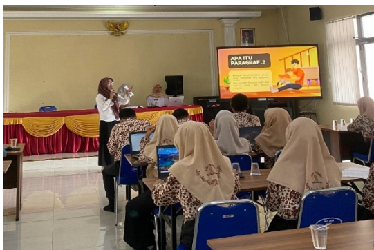
Gambar 1. Penyampaian materi

Metode pelaksanaan kegiatan pengabdian ini dilaksanakan di SMKN 2 Adiwerna dengan menggunakan pendekatan edukatif dan partisipatif. Kegiatan ini dirancang untuk memberikan pemahaman serta keterampilan kepada peserta dalam penulisan artikel populer melalui tahapan yang sistematis dan terstruktur. Pelaksanaan program kegiatan ini dilakukan selama tiga hari. Kegiatan dilaksanakan setiap harinya mulai pukul 08.00 WIB sampai dengan 10.00 WIB. Pada hari pertama dan kedua, kegiatan difokuskan pada penyampaian materi yang meliputi pengenalan artikel populer, cara membuat kerangka tulisan, serta penyusunan paragraf secara sistematis. Selain itu, peserta juga diberikan pemahaman mengenai penulisan daftar pustaka sesuai dengan kaidah penulisan yang berlaku. Pada hari ketiga, kegiatan difokuskan pada praktik menulis artikel populer sebagai bentuk penerapan materi yang telah dipelajari sebelumnya. Setelah kegiatan pelatihan selesai, dilaksanakan lomba penulisan artikel populer sebagai bentuk evaluasi untuk mengukur kemampuan peserta dalam memahami dan mengaplikasikan materi yang telah diberikan.