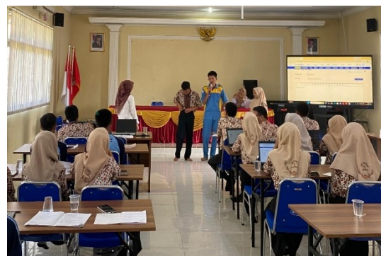
Gambar 2. Sesi tanya jawab dan diskusi

Metode yang digunakan dalam kegiatan pengabdian ini ialah pendekatan edukatif dan partisipatif. Pendekatan edukatif dilakukan melalui penyampaian materi mengenai pengenalan artikel populer, cara membuat kerangka tulisan, penyusunan paragraf, serta penulisan daftar pustaka sesuai dengan kaidah penulisan yang berlaku. Pemateri juga memberikan contoh penulisan artikel agar peserta lebih mudah memahami materi yang disampaikan. Sementara itu, pendekatan partisipatif dilakukan dengan melibatkan siswa dan siswi secara aktif melalui sesi tanya jawab dan diskusi selama kegiatan berlangsung. Pada hari terakhir, peserta diberikan praktik menulis artikel populer sebagai bentuk penerapan materi yang telah dipelajari sebelumnya. Setelah kegiatan pelatihan, peserta juga dilibatkan dalam lomba penulisan artikel populer sebagai bentuk evaluasi berbasis praktik. Melalui metode tersebut, diharapkan peserta dapat memahami tata cara penulisan yang baik dan benar serta mampu mengembangkan ide dan gagasan secara lebih sistematis dalam bentuk tulisan.