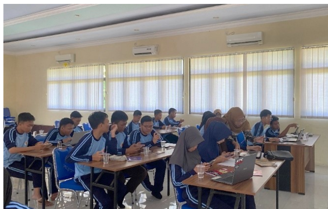
Gambar 3. Sesi praktik menulis artikel

Sebagai bentuk evaluasi terhadap hasil pelatihan, diselenggarakan lomba penulisan artikel populer setelah kegiatan pelatihan selesai. Lomba ini bertujuan untuk mengukur sejauh mana pemahaman dan kemampuan peserta dalam mengaplikasikan materi yang telah diperoleh selama pelatihan. Dalam pelaksanaan lomba, ditetapkan empat tema utama, yaitu pendidikan, lingkungan, teknologi, dan budaya, yang bertujuan untuk memberikan ruang bagi peserta dalam