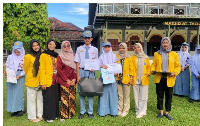
Gambar 5. Penyerahan penghargaan kepada pemenang lomba artikel populer