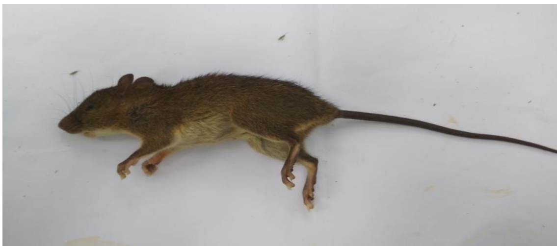
Gambar 1. Rattus Tiomanicus (tikus pohon)

Rattus. tiomanicus (tikus pohon) termasuk golongan omnivora (pemakan segala), tetapi cenderung untuk memakan biji-bijian atau sereal. Tikus pohon memiliki kemampuan fisik yang baik untuk memanjat ini di tunjukkan oleh adanya tonjolan pada telapak kaki yang di sebut dengan footpad