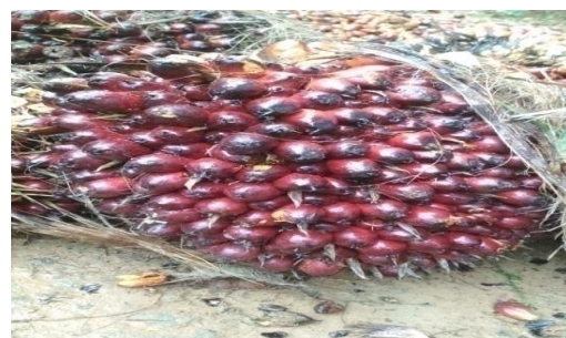
Gambar 4. Buah yang tidak terserang hama tikus

Serangan tikus pada tanaman kelapa sawit tidak tergantung dengan musim. Namun ada kecenderungan bahwa