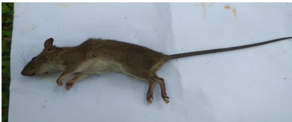
Gambar 2. Rattus Argentiventer (tikus sawah)

Rattus. argentiventer (tikus sawah) dalam penyebarannya termasuk dalam jenis peridomestik, yaitu spesies tikus yang aktivitas hidupnya berada di lahan pertanian, perkebunan, dan sekitar pemukiman manusia. Namun, pada umumnya tikus ini memiliki habitat di sawah dan daerah-daerah yang berdekatan dengan sumber air irigasi. Menurut Sudarmaji. (2008),